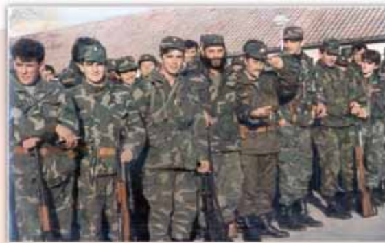
Prvo postrojavanje u Kuli, 06. 10. 1991.

Fran Krsto Frankopan, hrvatski plemić, vojskovođa i pjesnik