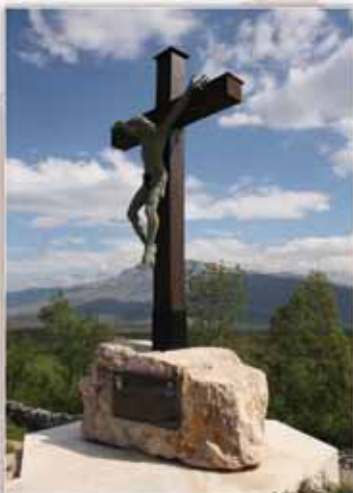
Pod ovim smo se borili