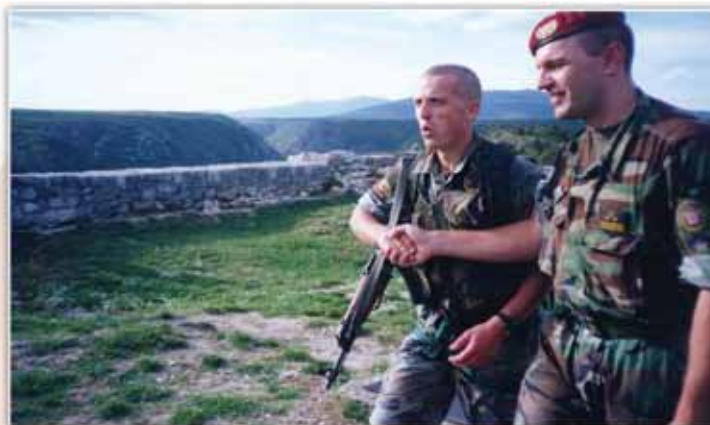
Knin je naš, kolovoz 1995..