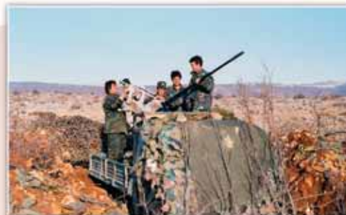
PZO hrvatski branitelji kod Čačijinog Doca, veljača 1992.