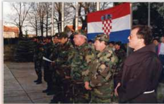
Prvi govor na osnivanju 126. br HV, Sinj, 06. listopada 1991.

Ivan Kukuljević Sakcinski, hrvatski povjesničar, književnik i političar