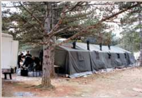
Logistička baza na Kukuzovcu, 1991.