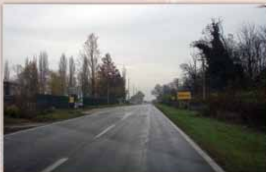
Ulaz u grad heroj Vukovar, gdje je poginuo Željko