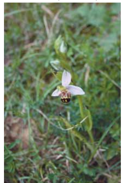
ŠOLJANOVA KOKICA ( Ophrys apifera )