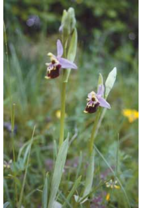
PČELINA KOKICA ( Ophrys apifera )