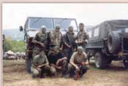
Hrvatski branitelji na Dinari, srpanj 1993.