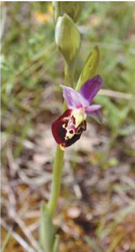
BUMBAREVA KOKICA ( Ophrys fuciflora )