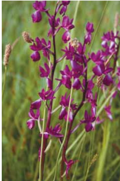
RAHLI KAĆUN ( Orchis laxiflora )

Cvjetaju već od travnja pa do srpnja, neke pojedinačno, a neke u velikim skupinama.