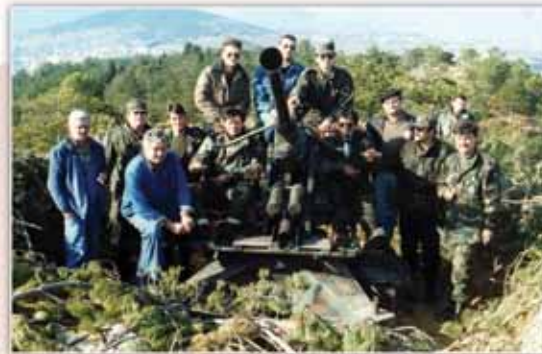
Kompletna ekipa PZO na Kuku iznad Sinja, listopad 1991.