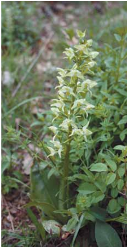
ZELENKASTI VIMENJAK ( Platathera chlorantha )