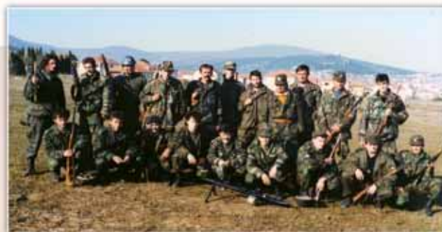
Zajednički snimak nakon smjene, listopad 1991.