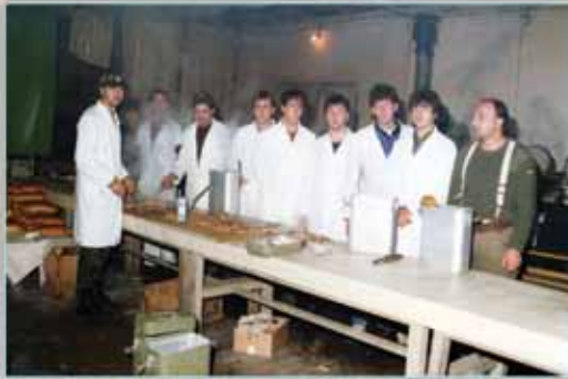
Kuhari pripremaju tisuće porecija za branitelje, Kukuzovac, studeni 1991.