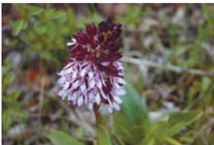
GRIMIZNI KAĆUN ( Orchis purpurea )