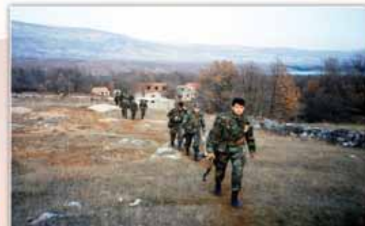
Odlazak na Babića brig kod „Kenedija“, ožujak 1993.