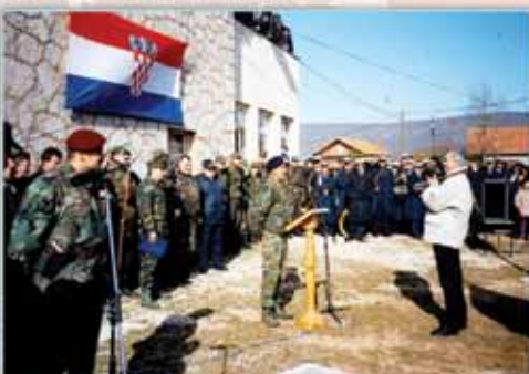
General Daidža drži govor hrvatskim braniteljima, Diemo, travanj 1993.