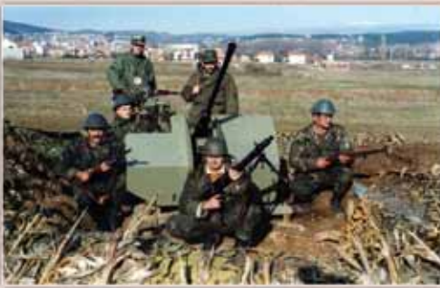
Protuzračna obrana Sinja